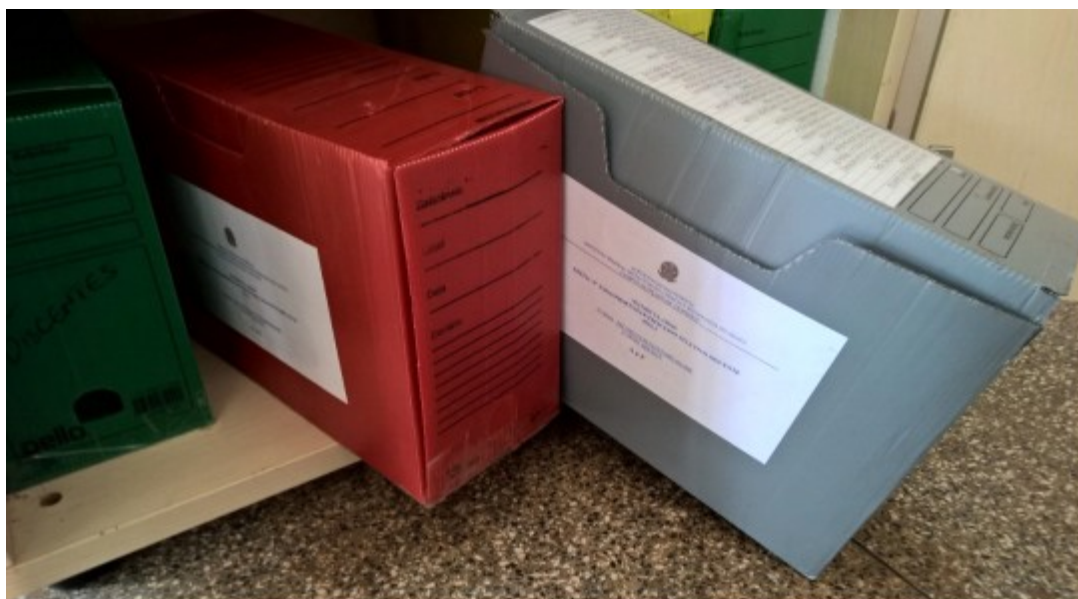
Imagem 3 – Documentos referentes às Atividades-Fim do Campus Oiapoque