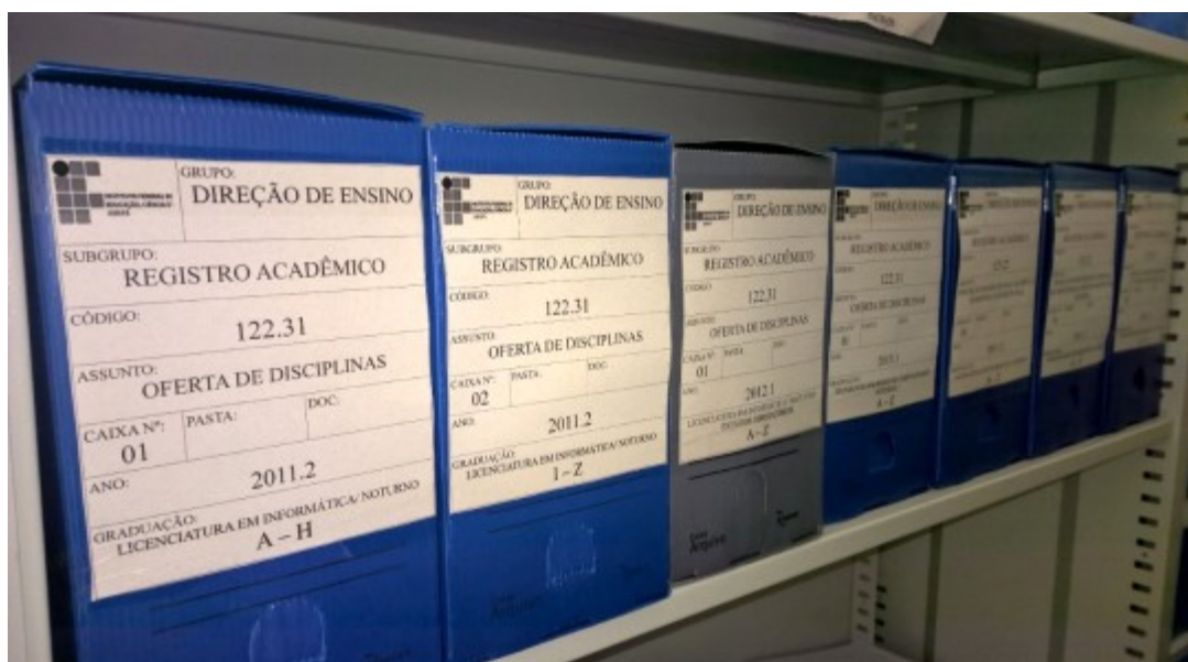
Imagem 2 – Documentos classificados